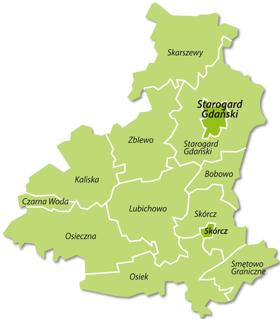
Mapa powiatu starogardzkiego