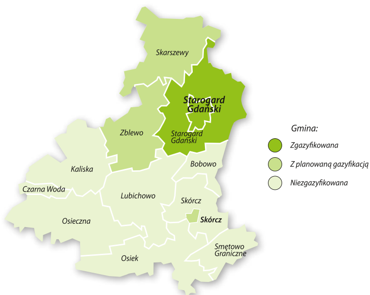
Ryc. 1. Mapa systemu dystrybucyjnego Polska Spółka Gazownictwa sp. z o.o. Oddział w Gdańsku