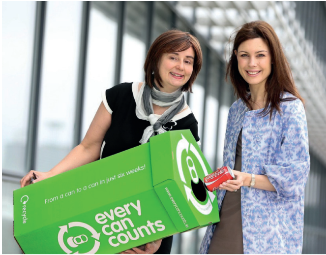
Zbiórka puszek w miejscu pracy.