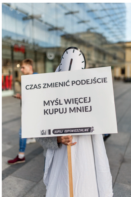
Happening z okazji Dnia bez Kupowania.

kampanie dotyczące zabawek, elektroniki, odzieży oraz drewna i papieru. Podczas trwania projektu edukujemy społeczeństwo, zwykle w czasie festiwali i różnych wydarzeń, organizujemy happeningi, zbieramy podpisy pod petycjami, współpracujemy ze szkołami, kontaktujemy się z firmami, aby zmienić ich politykę dotyczącą praw pracowniczych oraz wpływu na środowisko, przygotowujemy raporty i artykuły mówiące o problemach i rozwiązaniach ważnych dla danej kampanii. Ponadto mamy profil na Facebooku, na którym wiele można się dowiedzieć na temat szeroko pojętej odpowiedzialnej konsumpcji, idei Zero Waste, wegetarianizmu oraz różnych ekologicznych i etycznych rozwiązań.