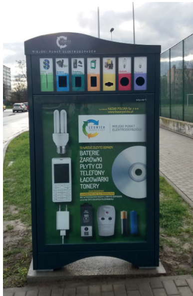
Tak wygląda Miejski Punkt Elektroodpadów.

Głównym problemem był wybór odpowiedniej lokalizacji. Chcieliśmy, aby były to miejsca łatwo dostępne, na trasach często uczęszczanych przez mieszkańców, w różnych częściach miasta. Wybrane przez nas miejsca musiały być uzgodnione; stosowne zgody musieliśmy uzyskać od różnych podmiotów. I tak na przykład należy sprawdzić, czy miejsce znajduje się w strefie ochrony konserwatorskiej, albo uzgodnić z zarządcą drogi konkretne miejsce na chodniku. Lokalizację przedstawiono na kolegium Prezydenta Miasta. Potrzebne jest zgłoszenie budowy obiektu lub zgłoszenie wykonania obiektów niewymagających pozwolenia na budowę. Pracownicy Wydziału Środowiska i Gospodarowania odpadami sprawdzili wiele lokalizacji, nim ostatecznie zatwierdzono aktualne usytuowanie kontenerów.