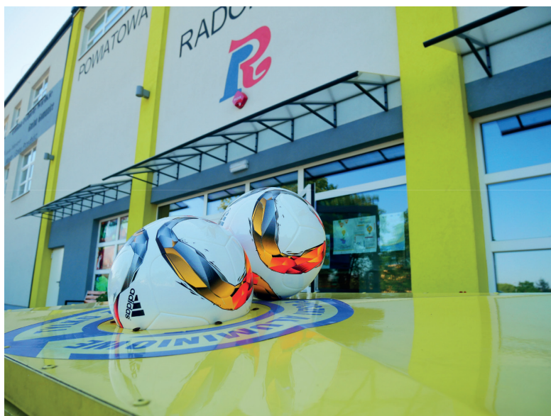
Piłki za puszki.

4. Piłki za Puszki. Aktywność fizyczna sprzyja zdrowiu. Recykling oszczędza zasoby naturalne, tym samym przyczynia się do utrzymania środowiska w dobrej kondycji. Obie idee są myślą przewodnią akcji „Piłki za puszki”.