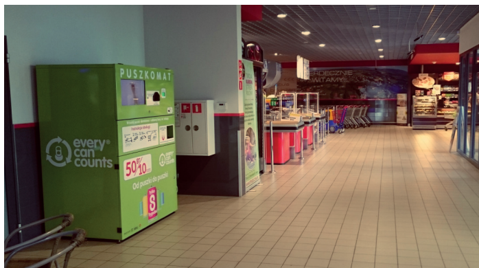
Puszkomat w sklepie.

4. Piłki za Puszki. Aktywność fizyczna sprzyja zdrowiu. Recykling oszczędza zasoby naturalne, tym samym przyczynia się do utrzymania środowiska w dobrej kondycji. Obie idee są myślą przewodnią akcji „Piłki za puszki”.