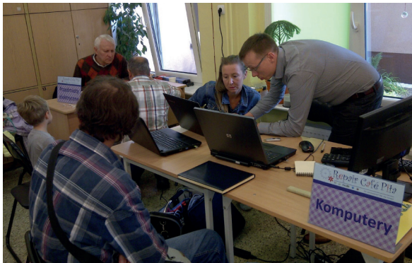
Naprawy w punkcie Repair Café Piła.

Fachowcy uczestniczą w naszych spotkaniach rotacyjnie (np. serwis rowerowy w sezonie wiosenno-letnim), jednak staramy się, aby jak najczęściej wszyscy byli do dyspozycji naszych mieszkańców.