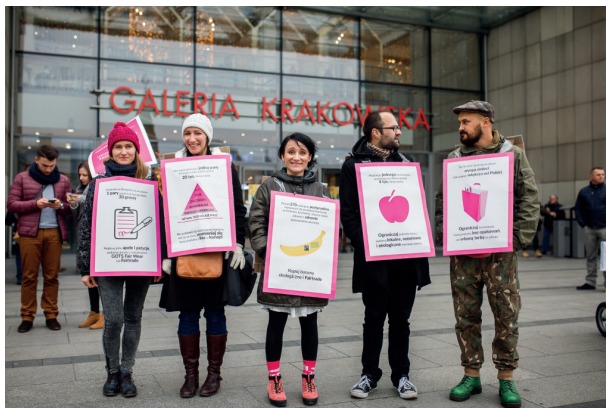
Happening z okazji Dnia bez Kupowania.

Jeśli nie mamy tej wiedzy, to najlepiej trzymać się kilku zasad: kupować lokalne i sezonowe produkty, minimalizować ilość produktów odzwierzęcych w swojej diecie, nie kupować produktów wysoko przetworzonych, zaopatrywać się w komisach i w sklepach typu second hand . Chodzić na zakupy z własną torbą, listą zakupów i przede wszystkim nie kupować niepotrzebnych przedmiotów. Bardzo ważne jest również, aby nie marnować żywności.