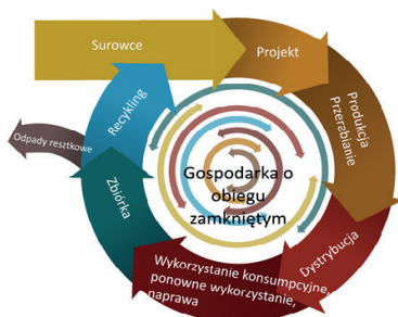
Rys. 2. Gospodarka o obiegu zamkniętym, Komunikat Komisji Europejskiej: Ku gospodarce o obiegu zamkniętym, 02.07.2014.

Celem jest zbudowanie gospodarki o obiegu zamkniętym, czyli przejście z modelu linearnego na model cyrkularny, działający zgodnie z zasadą: weź – użyj – przetwórz – użyj ponownie.